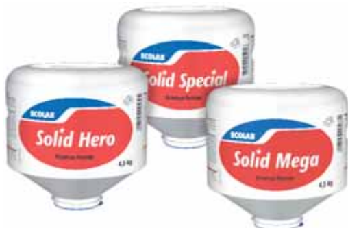
I prodotti solidi determinano un eccellente ed efficiente lavaggio di piatti e stoviglie, con livelli massimi di sicurezza per gli operatori.