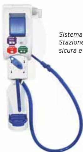
Sistema di Dosaggio Penguin 4U - Stazione di dosaggio efficiente, sicura e modulare.

Oasis Pro - Un'ampia gamma di prodotti superconcentrati per eccellenti risultati di pulizia, sicurezza e controllo dei costi.