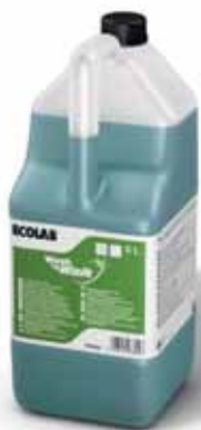
Wash 'n Walk - Detergente a doppia azione (chimica ed enzimatica) senza risciacquo per i pavimenti della cucina.