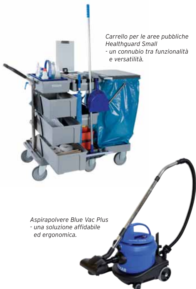
Carrello per le aree pubbliche Healthguard Small - un connubio tra funzionalità e versatilità.